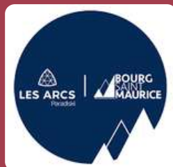
VILLE DE BOURG-SAINT-MAURICE 2020-2021