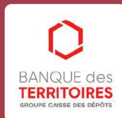
BANQUE DES TERRITOIRES 2023-2024