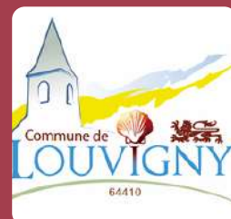
VILLE DE LOUVIGNY (CALVADOS) 2023-2024