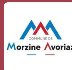
MORZINE AVORIAZ 2025-2026