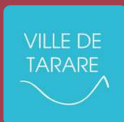
VILLE DE TARARE 2022-2023