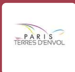
EPT TERRE D'ENVOL 2022-2025