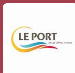
COMMUNE DU PORT (LA RÉUNION) 2018-2025