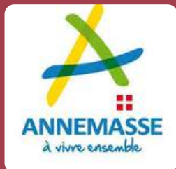
VILLE D'ANNEMASSE 2022-2023