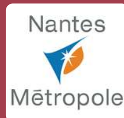
NANTES METROPOLE 2025-2026