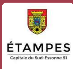
VILLE D'ETAMPES 2021-2022