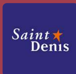
SAINT DENIS (93) 2025-2026