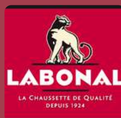
VILLE DE DAMBACH-LA-VILLE / LABONAL 2022-2023