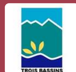
VILLE DE TROIS BASSINS (ÎLE DE LA RÉUNION) 2022