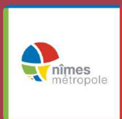
NÎMES MÉTROPOLE (GARD) 2022