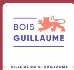
VILLE DE BOIS GUILLAUME 2022-2025